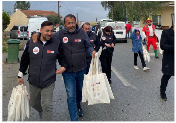
Ramazan sofraları kardeşliği büyütür.