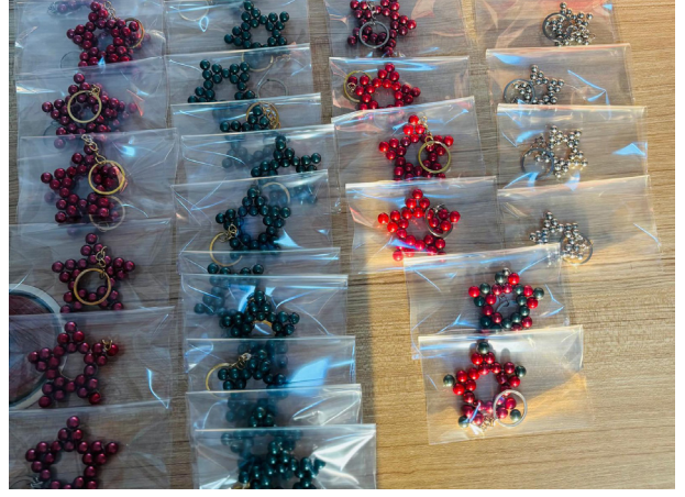
Evkaf İyilik Gönüllüleri, düzenlenen atölye etkinliğinde el emeği anahtarlıklar hazırladı.

Çalışma, gönüllüler arasında ekip ruhunu güçlendirirken üretkenliğin önemine de dikkat çekti.