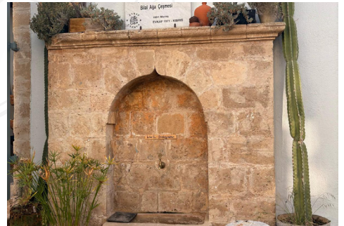
Kapalı Maraş'ta Bilal Ağa Mescidi ve Kültür Merkezi'ne gerçekleştirilen kültürel ziyaretten bir kare