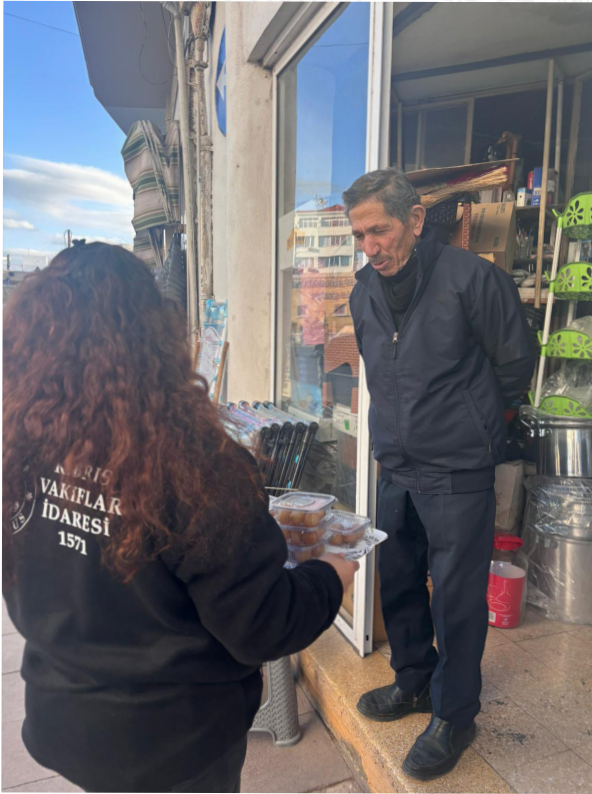
“Cezerye ve dua, gönüllerimizde birleşti.”