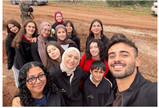
"Gelecek nesillere nefes bırakıyoruz."

Etkinlik sırasında genç gönüllüler, çevre bilincinin önemine dikkat çekerek, yeşil alanların korunması ve yaşanabilir bir gelecek için tüm halkımızı çevreye sahip çıkmaya davet etti.