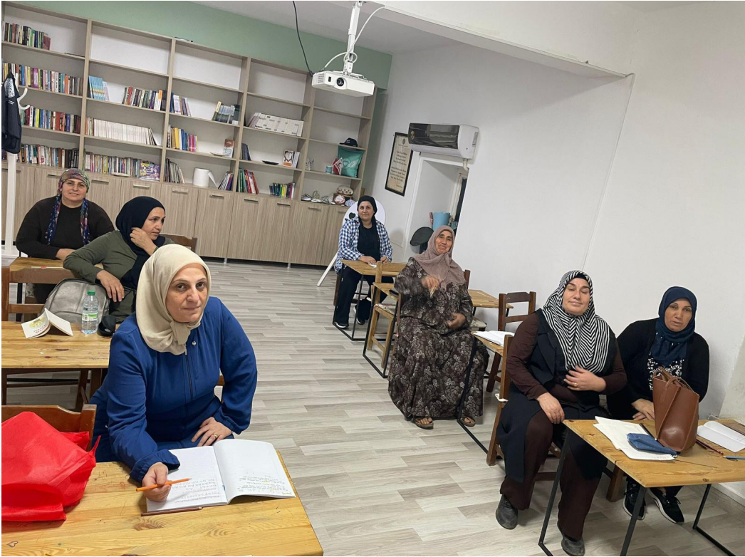
"Eğitimle güçlenen bireyler, güçlü bir toplum."

Eğitimde fırsat eşitliğini destekleyen bu kurslar aracılığıyla, bireylerin akademik ve kişisel gelişimlerine katkı sağlandı.