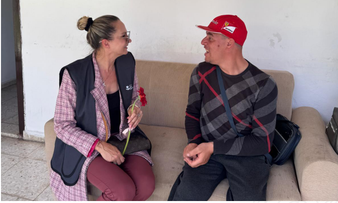
Evkaf İyilik Gönüllüleri, engelli bireylerin ailelerini evlerinde ziyaret ederek desteklerini ilettiler.

Gönüllüler, ziyaretler sırasında temizlik setleri ve günlük yaşamı kolaylaştıracak destekler sunarken, yalnızca maddi katkı değil; sevgi, empati ve birlikte olma duygusunu da paylaştı. Engelliler Haftası kapsamında gerçekleştirilen bu ziyaretler, toplumsal farkındalığı artıran örnek dayanışma çalışmaları arasında yer aldı.