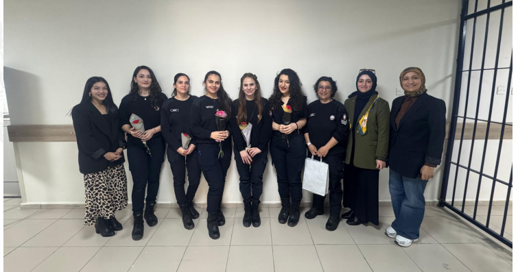
İyilik, duvarları aşar.