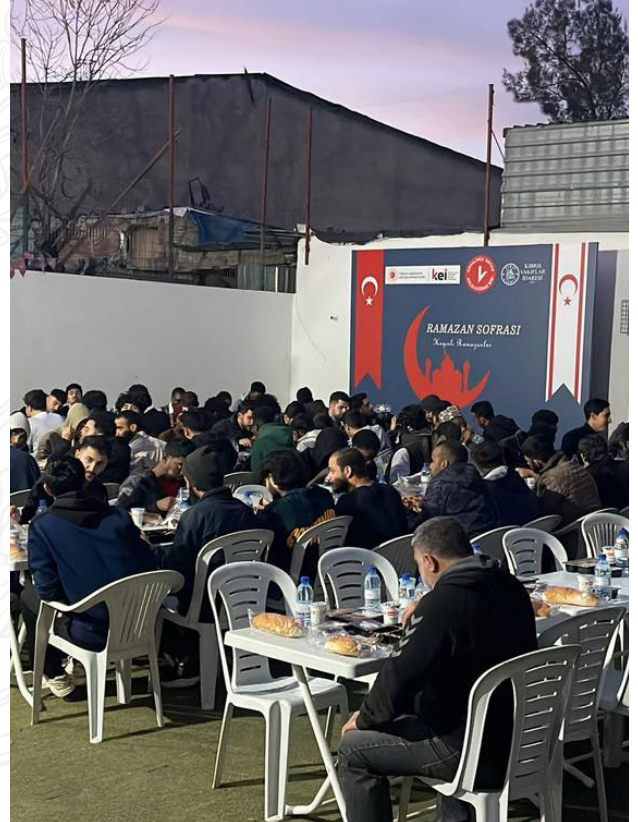
Aynı sofrada buluşan eller, Ramazan'ın bereketini çoğalttı.