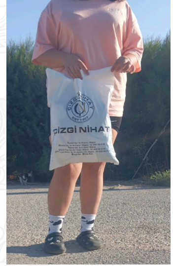
Okul yolu umutla başlar.