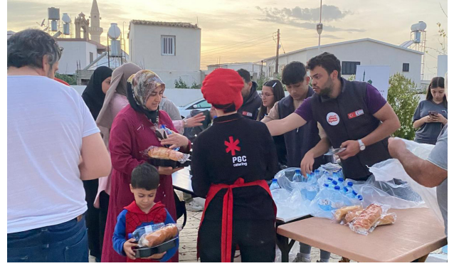
Aynı sofrada buluşan gönüller.

Ramazan ayının manevi atmosferini toplumun her kesimine ulaştırmayı amaçlayan organizasyon kapsamında; Lefkoşa, Girne, Güzelyurt, Gazimağusa, İskele ve Lefke ilçelerinde toplam 21 noktada sabit iftar sofraları kuruldu. Her gün yüzlerce vatandaşın ağırlandığı bu sofralar, paylaşma ve dayanışma ruhunu canlı tutarken, Ramazan'ın manevi iklimini adanın dört bir yanına taşıdı.