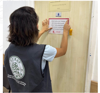
Evkaf İyilik Gönüllüleri Ekibi, Cengiz Topel Hastanesi ile Kalkanlı Yaşam Evi'ne gerçekleştirilen ziyaretlerde toplumsal dayanışma ruhunu sergiledi.