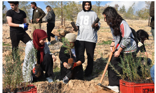
"Her fidan, umut dolu bir yarın demek."