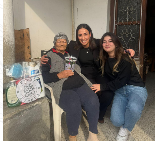
Gönüllere dokunmak, bayramı birlikte yaşamak için bir aradayız.