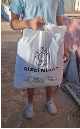
Hazırım, okula gidiyorum!

Bu küçük destek, öğrencilerin eğitim motivasyonunu artırırken, Evkaf İyilik Gönüllüleri'nin toplumsal farkındalık ve dayanışma misyonunu bir kez daha gözler önüne serdi.