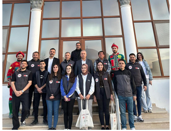
Bir lokma, bin dua.

Ramazan ayı boyunca gerçekleştirilen bu organizasyonlarla, paylaşmanın bereketi yaşatıldı; iyilik sofraları gönüllerden gönüllere taşındı.