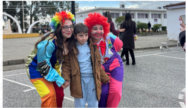
Fikri Karayel İlkokulu'nda düzenlenen yılbaşı etkinliğinde palyaço ve yüz boyama aktiviteleriyle eğlenceli anlar yaşayan öğrenciler.