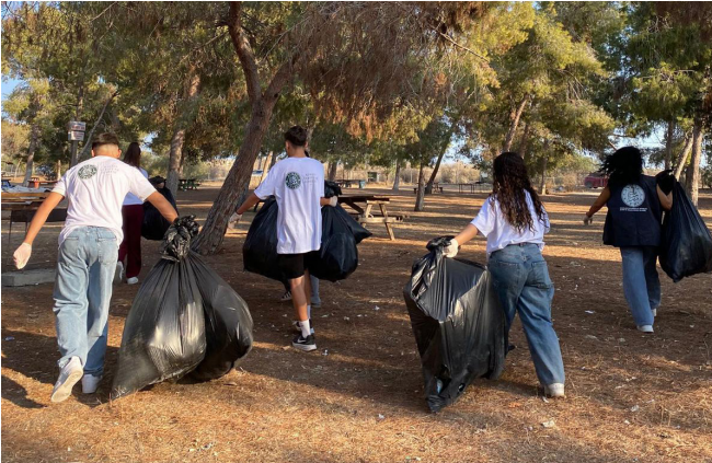
Bedis Sahili'nde düzenlenen çevre temizliği etkinliğinde gönüllüler ekibi sahil boyunca biriken atıkları toplayarak doğanın korunmasına katkı sağladı.