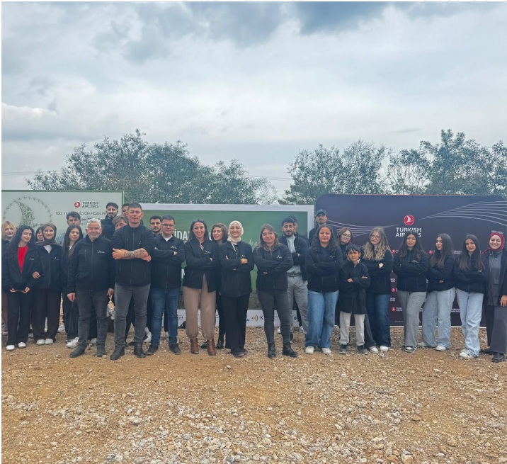
"100 Bin Zeytin Fidanı Dikim Projesi" kapsamında ilk fidanlar Esentepe'de düzenlenen törenle dikildi.

Projepaydaşlarıdaçalışmanınçevresel vetoplumsalöneminedikkatçekerken, Çataköy Belediyesi iş birliğiyle oluşturulacak arboretum projesiyle KKTC'de çevre bilincinin daha da güçlendirilmesinin hedeflendiği belirtildi.