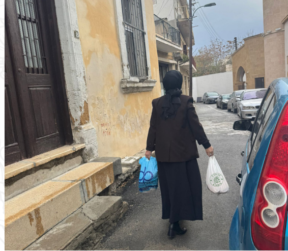
Bir kapı daha çalındı, Bir ev daha bayram etti.