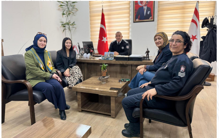
Bir gülümseme, bir günün kaderini değiştirebilir.