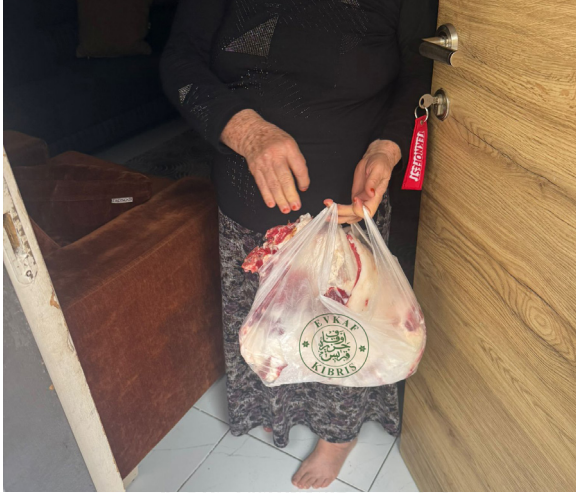
Kurban, paylaşınca gerçek anlamını buldu

Evkaf İyilik Gönüllüleri'nin çalışmalarıyla bir kez daha hayat buldu. Yapılan her dağıtım, bayram sevincini büyütürken; toplumsal dayanışmanın gücünü de görünür kıldı.