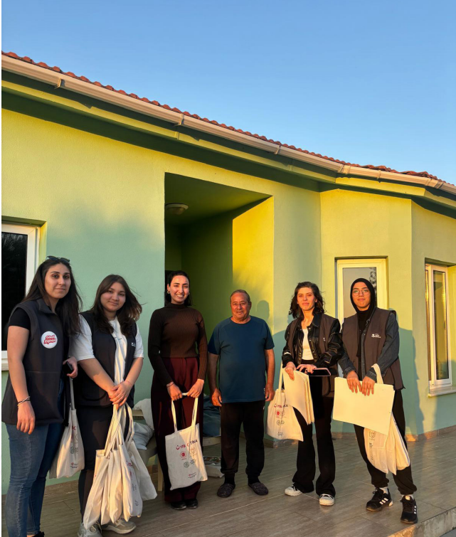
Bir sofraya, birçok dua.