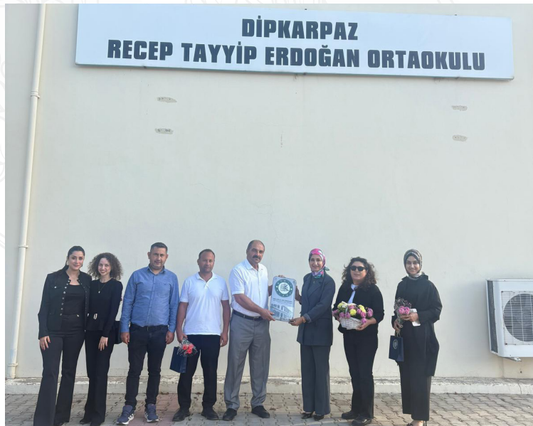
Evkaf, öğretmenleri ziyaret ederek Öğretmenler Günü'nü kutladı ve eğitim emekçilerine hediyeler takdim etti.