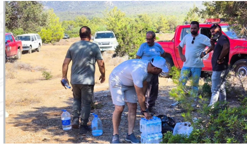
Cennet Vadisi'nde meydana gelen yangın sırasında Evkaf İyilik Gönüllüleri, sahadaki görev yapan ekiplere içme suyu ve şapka desteğinde bulunarak dayanışma örneği sergiledi.