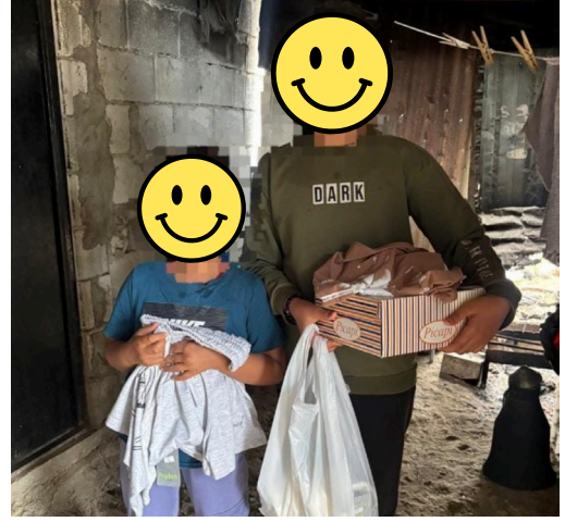
Evkaf İyilik Gönüllülerinden Kurban Bayramı'nda Anlamli Destek

Toplumsal dayanışma ve paylaşma kültürünü yaşatmayı sürdüren Evkaf İyilik Gönüllüleri, küçük dokunuşların büyük mutluluklara vesile olduğuna dikkat çekti.