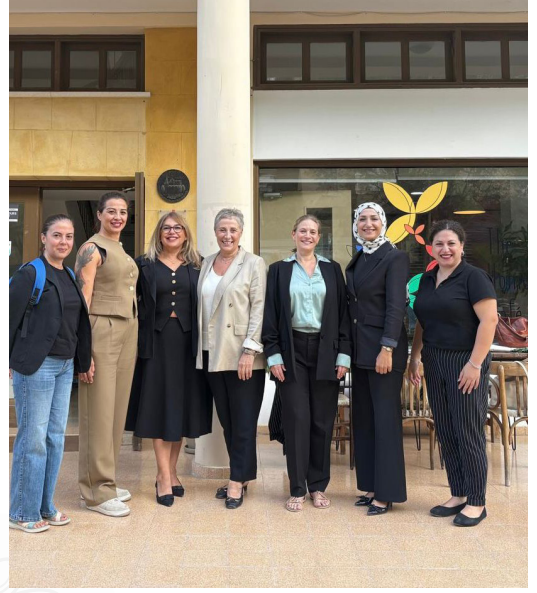
Kıbrıs Vakıflar İdaresi Evkaf İyilik Gönüllüleri, İsveç Büyükelçiliği temsilcileriyle bir araya gelerek sosyal sorumluluk projelerini paylaştı.

Kıbrıs Vakıflar İdaresi, köklü vakıf kültürüne bağlı olarak gençleri sosyal sorumluluk bilinciyle hareket etmeye teşvik etmeye ve uluslararası iş birliklerini güçlendirmeye devam ediyor.