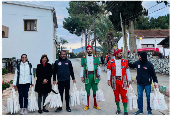
İftar sadece yemek değil, buluşmaktır.