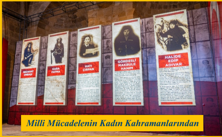
Milli Mücadelenin Kadın Kahramanlarından

Sergimiz 12 Temmuz 2023 tarihine kadar Lefkoşa, Bedesten’de haftanın 7 günü 09:00-17:00 aralıklarında açık olacaktır.