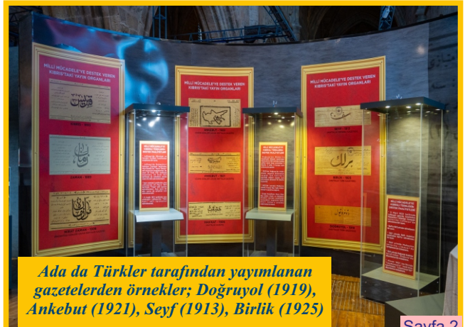
Ada da Türkler tarafından yayımlanan gazetelerden örnekler; Doğruyol (1919), Ankebut (1921), Seyf (1913), Birlik (1925)

Savaş esirlerine Mağusa'da ve esir kampında her türlü yardımda bulunmuş, onlara ders vermiş, Cuma ve cenaze namazlarını kıldırması, Anadolu'da Milli Mücadele'ye de maddi-manevi her türlü lojistik yardımda bulunmuştur.