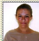
Ulus Çöli 5 Şubat